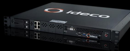
Ideco LX Cert