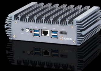
Ideco SX+ Cert