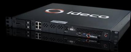
Ideco LX+ Cert