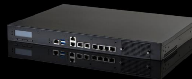
Ideco MX Cert